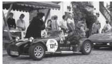
Lotus Super Seven S3, Baujahr 1969

Werbung für Waldenburg zu machen. Die Besetzung der Stempelstelle machte in historischen Kostümen auf Waldenburg aufmerksam. Der Bürgermeister übergab allen Teilnehmern einen Briefumschlag mit Werbematerial von Waldenburg.