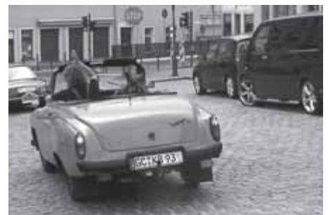
ein nicht gemeldeter Teilnehmer, als Beifahrer wahrscheinlich Kommissar Rex?