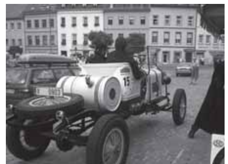
Skoda L+K 300 Rennwagen Baujahr 1920 zweitältestes teilnehmendes Fahrzeug