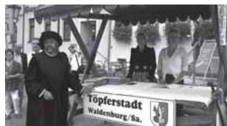
Durchfahrtskontrollstelle am Markt