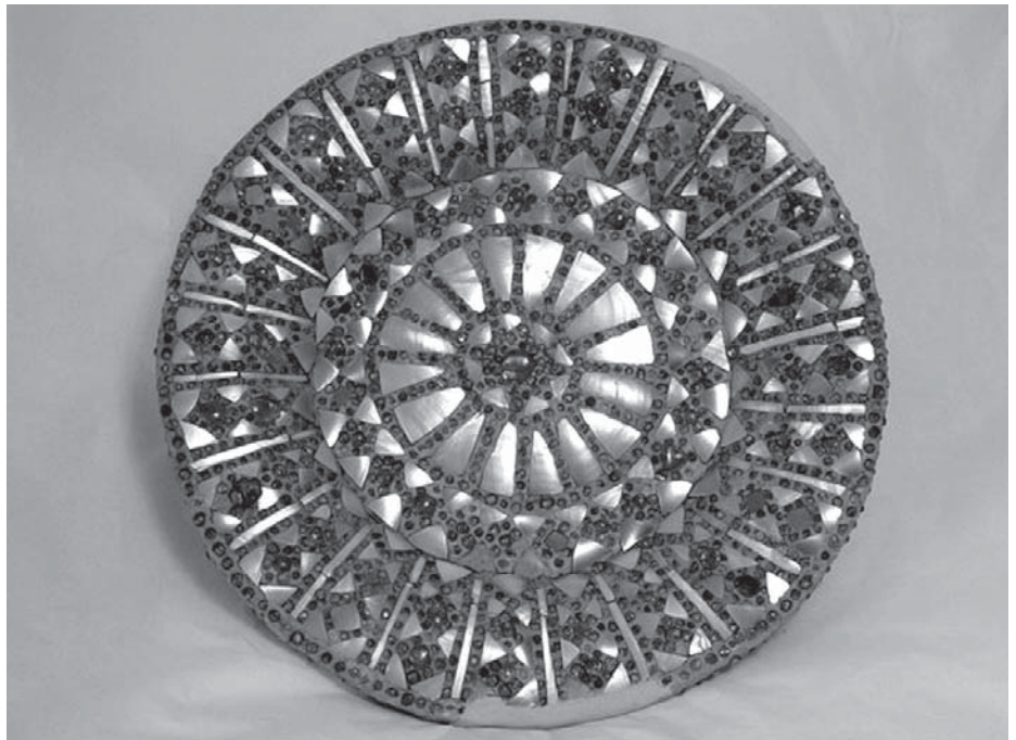
Wandteller mit Perlmutterbesatz, Sammlung Linck

Das Naturienkabinett zählt zu den ältesten Naturkundemuseen in Deutschland. Den Kern bildet die Kunst- und Naturaliensammlung der Apothekerfamilie Linck aus Leipzig, deren Anfänge im 17. Jahrhundert zu finden sind. Die historische Präsentation des 19. Jahrhunderts und der Erhalt der Sammlung Linck waren der Grund dafür, dass das Waldenburger Museum für eine Teilnahme am KUR-Programm der Kulturstiftung des Bundes („KUR“ – „Konservierung und Restaurierung“) ausgewählt wurde. Die umfangreiche Förderung hilft nun dabei, die Exponate wissenschaftlich zu erfassen, konservatorisch und restauratorisch zu betreuen und somit für die Zukunft zu sichern. 2008/2009 konnten schon wichtige Sammlungsstücke restauriert werden, wie beispielsweise die Schuhkollektion, asiatische Lackbecher und Wandteller mit Perlmutterbesatz, der Index Musaei Linckiani – ein gedrucktes Verzeichnis der Sammlung Linck – sowie die historischen Schauvitrienen von