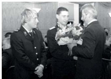
Jahreshauptversammlung im Gasthof „Goldener Hahn“