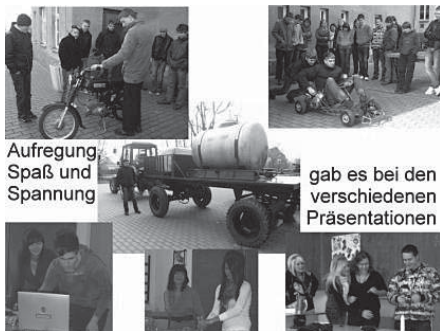
Aufregung, Spaß und Spannung

Es ist wieder so weit. Für unsere 10. Klasse beginnt der Prüfungsstress. Den Anfang bildete die Verteidigung ihrer Projektarbeiten im Vertiefungskurs, es folgten die Vorprüfungen in den Hauptfächern und ab dem 5. Mai laufen die schriftlichen und mündlichen Prüfungen. Wenn die Schüler sich dafür so toll vorbereiten wie für die Prüfungen im Vertiefungskurs, dann kann eigentlich nichts schief gehen. Mit viel Fleiß, Ideenreichtum, handwerklichem Geschick und gut geschwungenen Kochlöffeln erstellen sie ihre Projekte. Diese bestanden aus einem theoretischen und einem praktischen Teil und aus der Verteidigung ihrer Arbeit vor der Klasse und den Lehrern