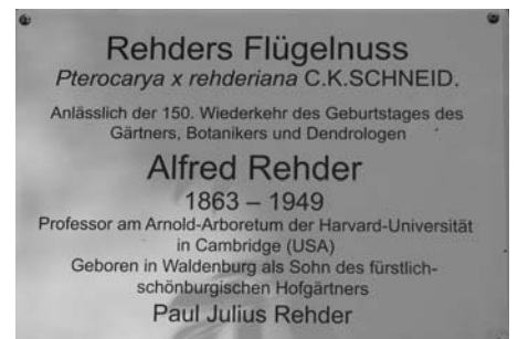
Gedenktafel anlässlich des 150. Geburtstages von Alfred Rehder