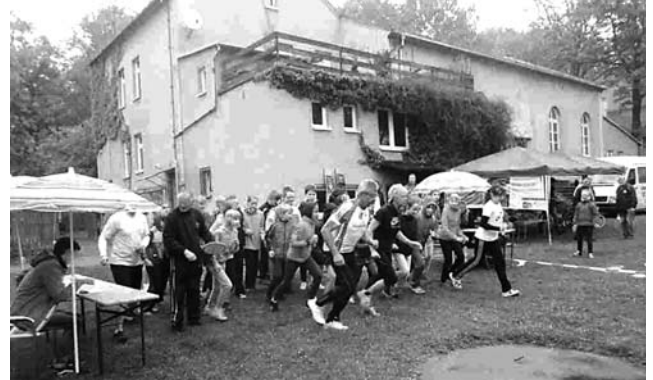
Start der beiden 5. Klassen mit dem Bürgermeister